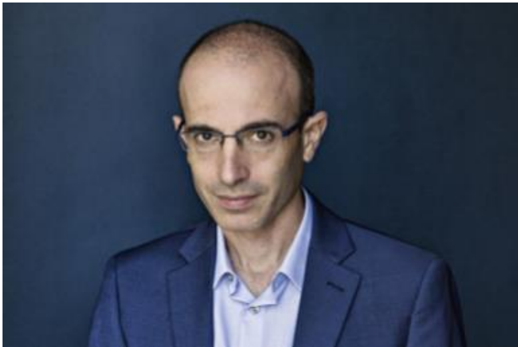
Yuval Noah Harari