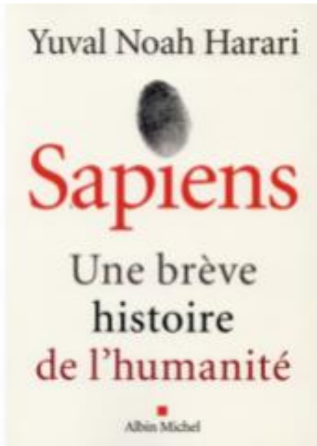
La couverture du livre français, allemand et anglais